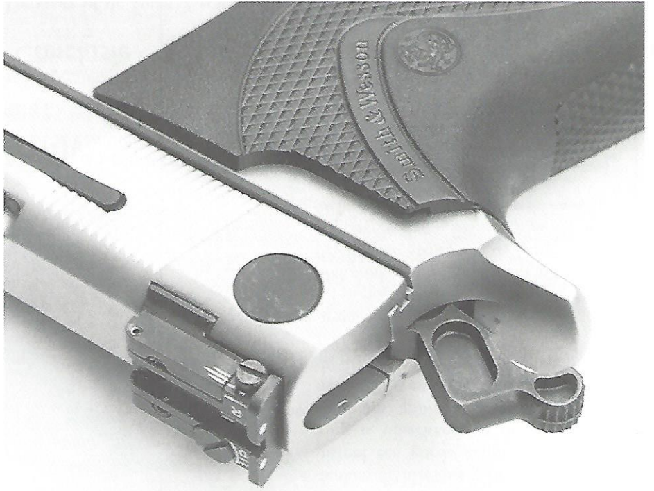
De Super 9 heeft een volledig verstelbare keep en deels uitgeholde hamer.

ééndelige kunststof greep, vergelijkendeling van de loop in de binnenzijde van de slede en een veiligheidsspal op de linkerzijde van de slede. Bij nader beschouwing vallen de verschillen op. De Super 9 heeft een verlengde slede en een langere loop (127 mm in plaats van 102 mm), een minder gekromde trekker die vanwege het single-action mechanisme verder naar achteren is geplaatst, en een volledig verstelbare target keep. Meer high-tech smufjes zijn er niet te vinden, en ook qua materiaalkuize is de