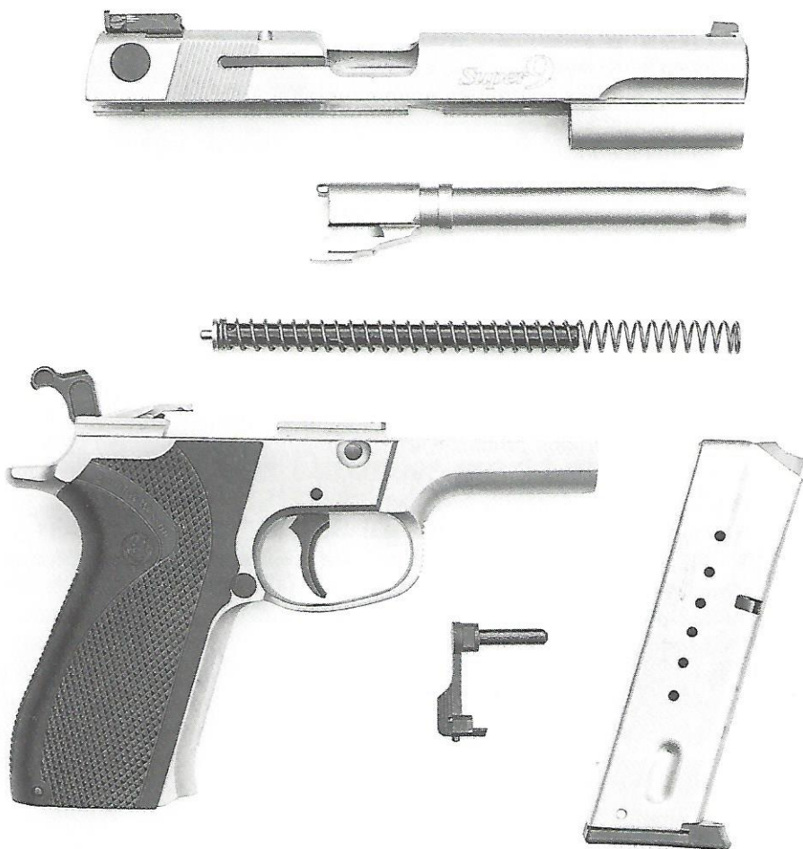
De Super 9 in hoofddelen. Weinig nieuws onder de zon, maar wel een prima afwerking.

Ondanks het relatief hoge gewicht van het pistool, springt de Super 9 aardig, zowel met Geco munitie als met de wat mildere 9 mm Para patronen van Magtech. Bij snelle schoten is de zaak niet zo eenvoudig weer op het doel te krijgen. Wat dat betreft had de greep iets stroever